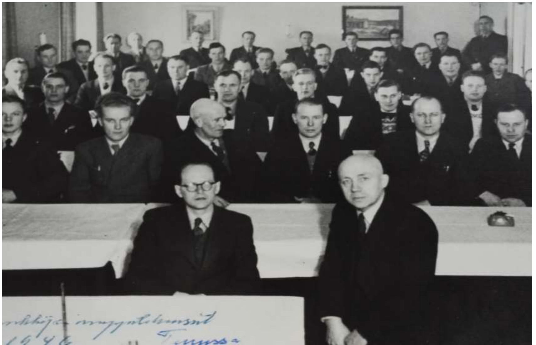
Hankkijan myyntikurssit Turussa vuonna 1946