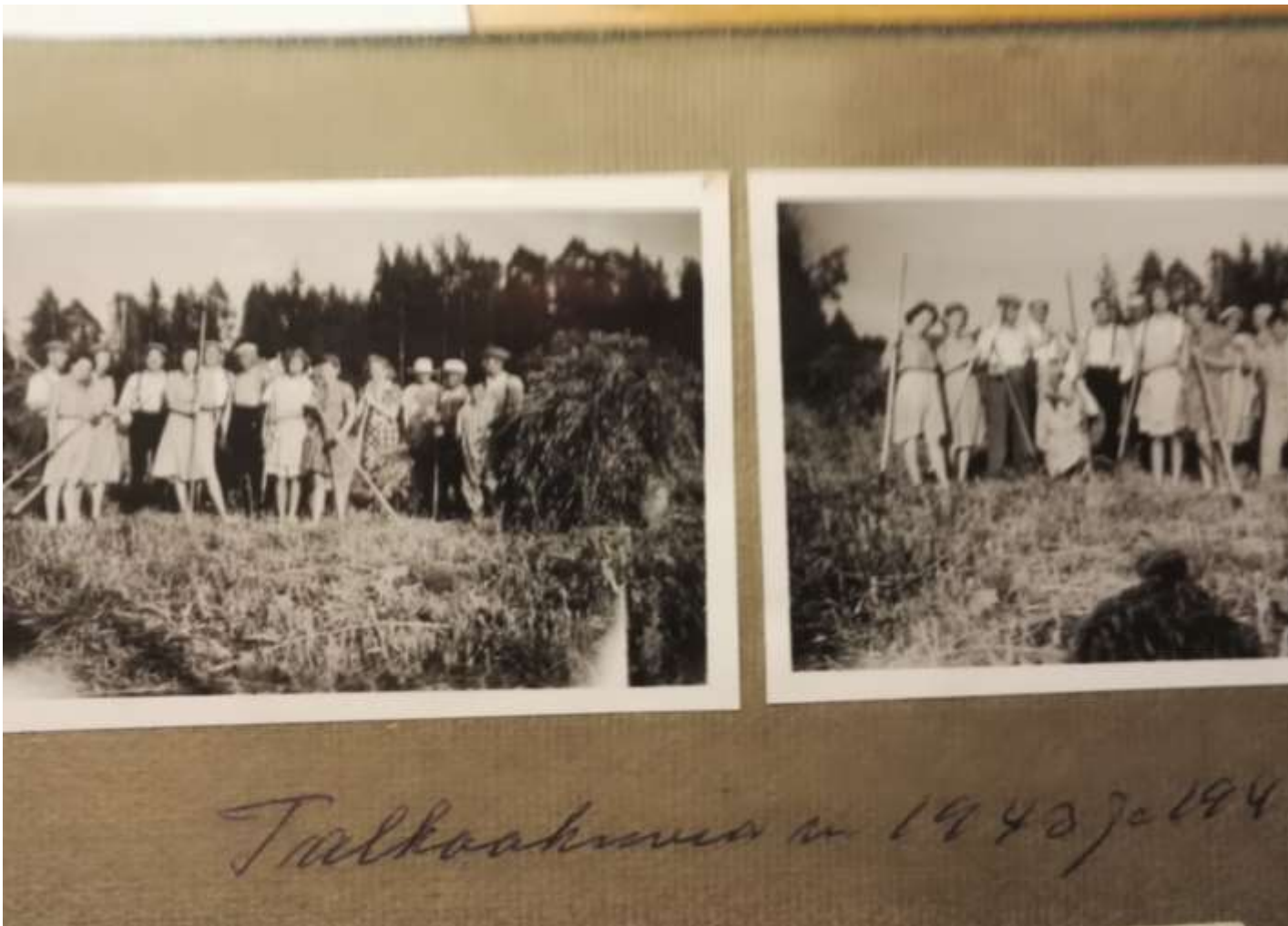
Talkooväkeä sotakesiltä 1943 ja 1944