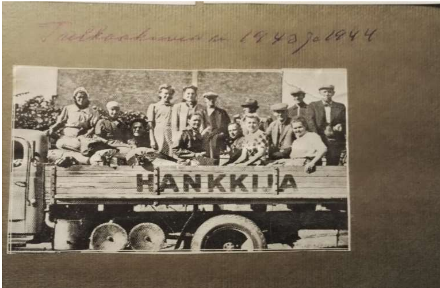
Hankkijalaiset talkoissa sotavuosina 1943 ja 1944