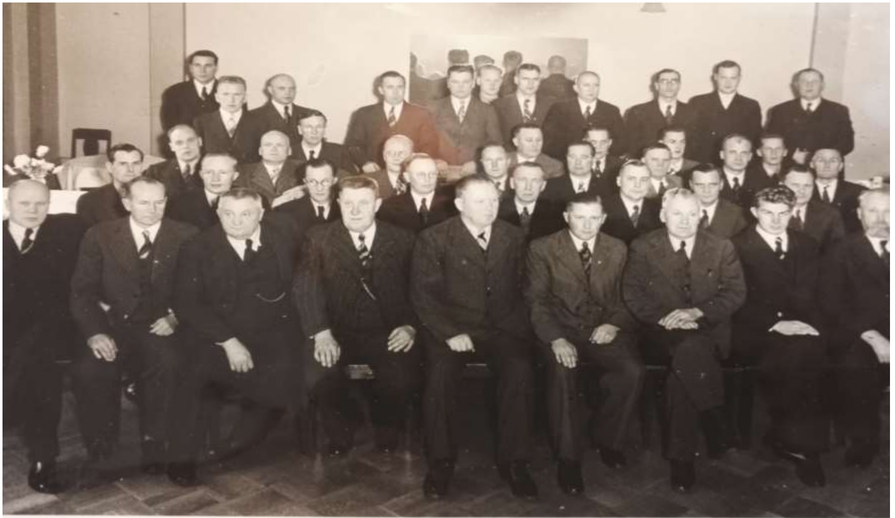
Hankkijan liikkeenhoitajien kokous 1937.

Hankkijan liikkeenhoitajien kokous vuonna 1937.