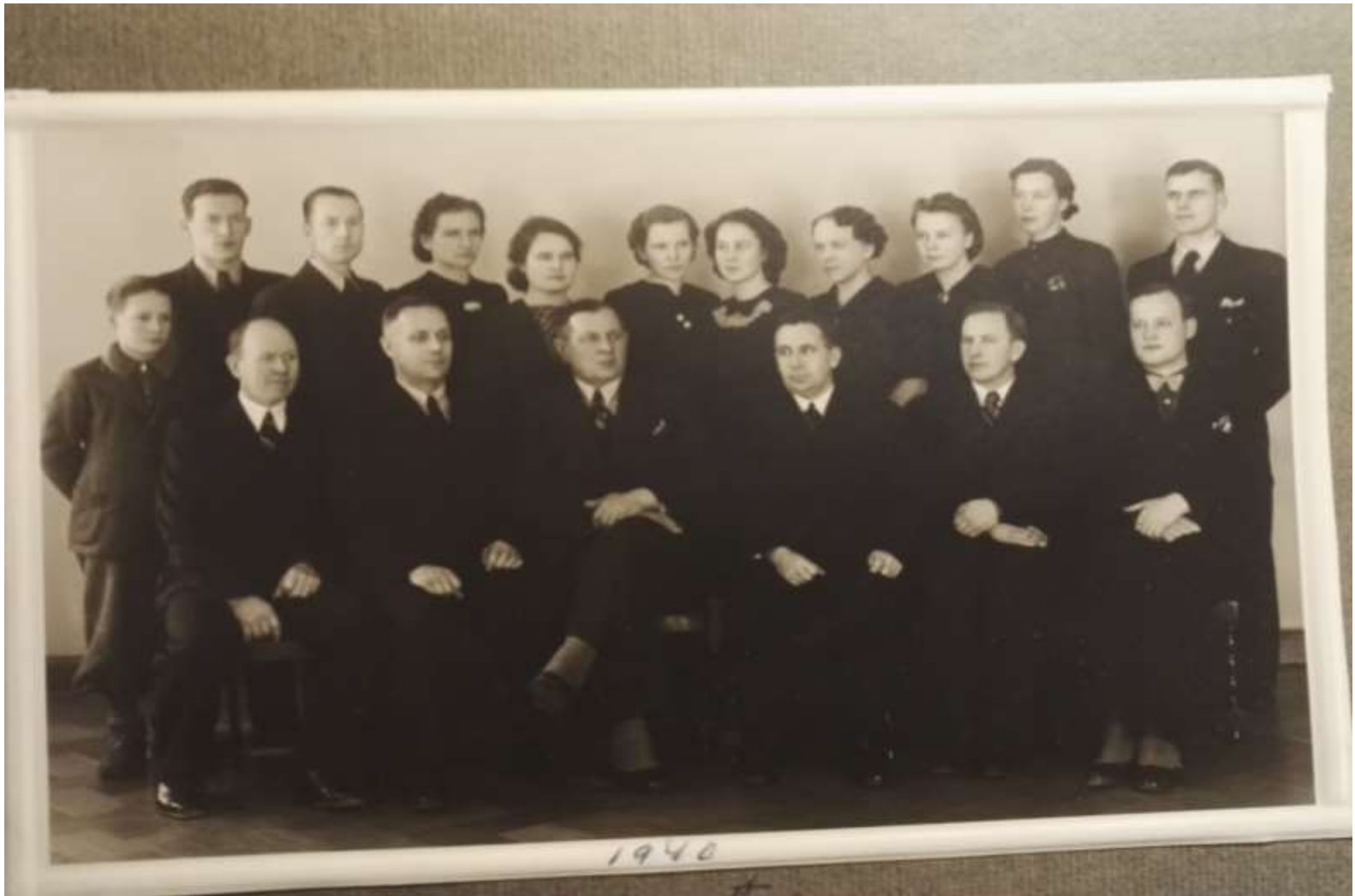
Turun Hankkijan henkilökuntaa vuonna 1940