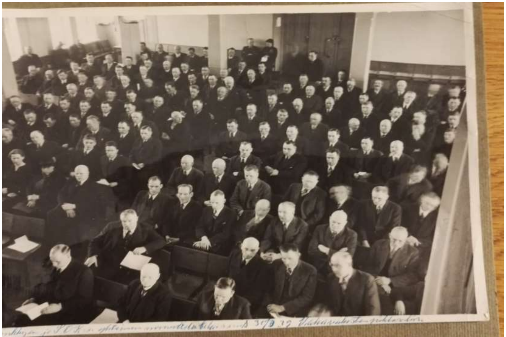
Hankkijan ja SOK:n yhteinen neuvottelutilaisuus 30.3.1939 Vähäväkisten juhlasalissa.