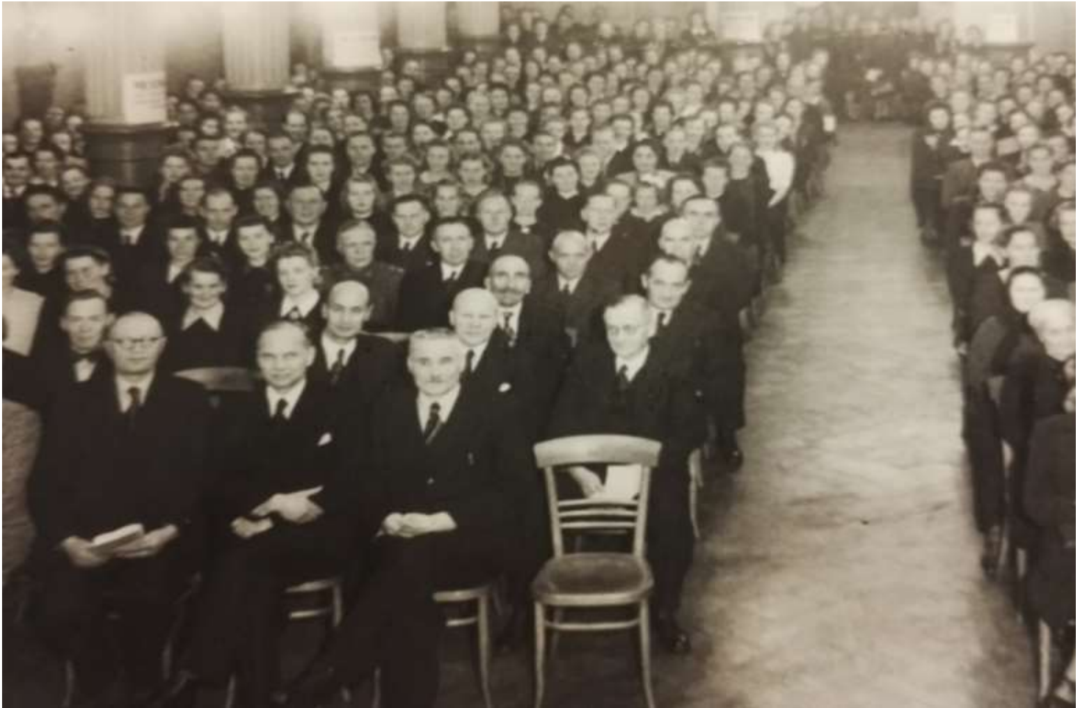
Varsinais-Suomen yhteistoimintakerhon juhla vuonna 1938.